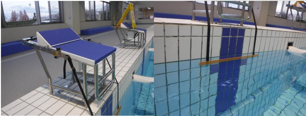
練習用スタート台 8台